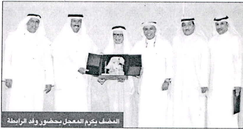
المضف بكرم المعجل بحضور وفد الرابطة

أبل: مصرون على أن تبقى «الشداوية» جزءاً لا يتجزأ من الجامعة