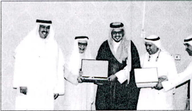
مدير عام الهيئة والعم فهد المعجل والمهندس وائل المطوع بكرمون الشيخ حمد الخالد

كرمت رابطة أعضاء هيئة التدريب بالكليات، المساهمين في حفل «وقفة وفاء» الذي اقيم في مارس الماضي، وذلك خلال الحفل الختامي لانشطة الرابطة للعام 2018، ائسس، برعاية وحضور مدير عام الهيئة العامة للتعليم التطبيقي والتدريب الدكتور علي المصنف، والنائب الدكتور خليل ابل، ومدير مكتب النائب الاول لرئيس مجلس الوزراء وزير الدفاع الشيخ حمد الخالد، حيث ثمن المصنف، جهود أعضاء الرابطة وجميع الفاعلين على الحفل، كما قدم الرئيس الفخري للرابطة العم فهد المعجل والمصنف